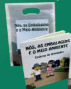
CONJUNTO DE EMBALAGENS E O MEIO AMBIENTE