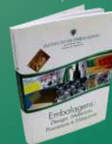
EMBALAGENS: DESIGN, MATERIAIS, PROCESSOS E MÁQUINAS