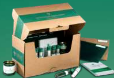
KIT DE REFERÊNCIAS DE EMBALAGENS