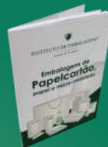
EMBALAGENS DE PAPELCARTÃO, PAPEL E MICRO-ONDULADO.