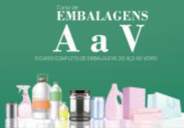
PRIMEIRO CURSO EMBALAGENS DE A A V